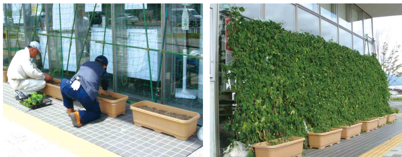
今年も支所南側にゴーヤのグリーンカーテンを作りました