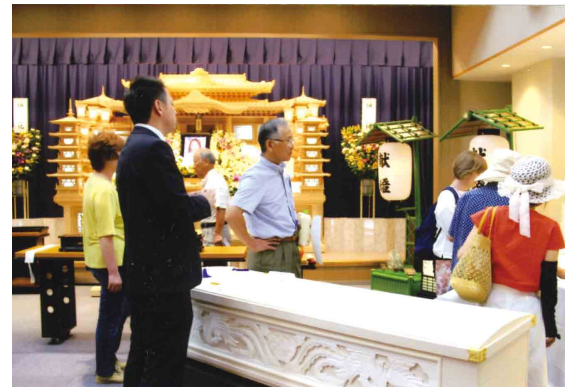
市民新聞 8月11日掲載

家族葬と一般葬のちがいや費用についてなどの基本的なことのほかに、個別の相談に近い質問まで出ましたが、朝陽安楽院の施設内を見学し、入棺体験もできました。