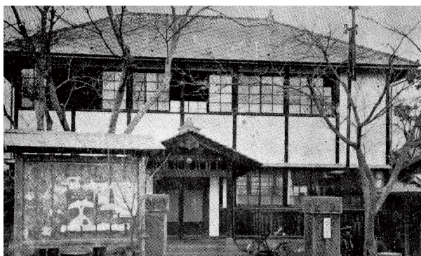
昭和30年発行「柳原村史」から 柳原村役場 現在の国道18号柳原中央バス停付近にあった