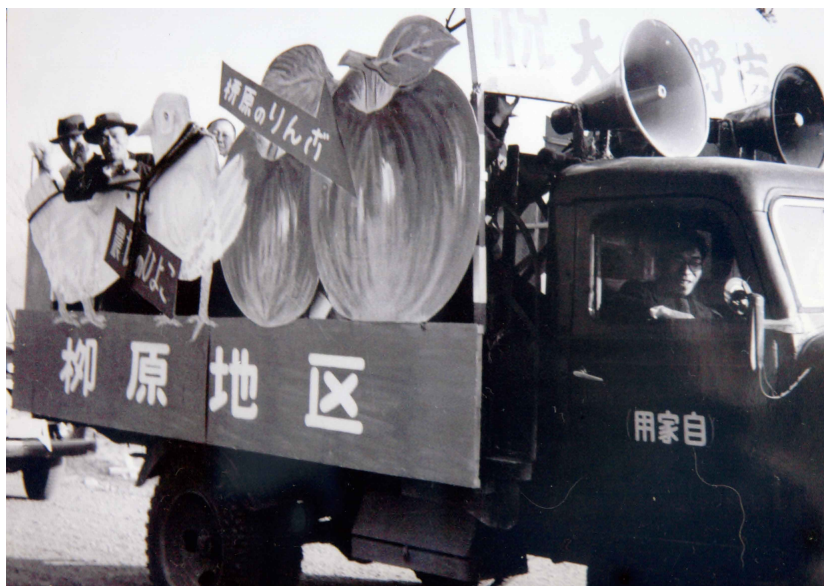
長野市合併を祝す『特産品パレード』