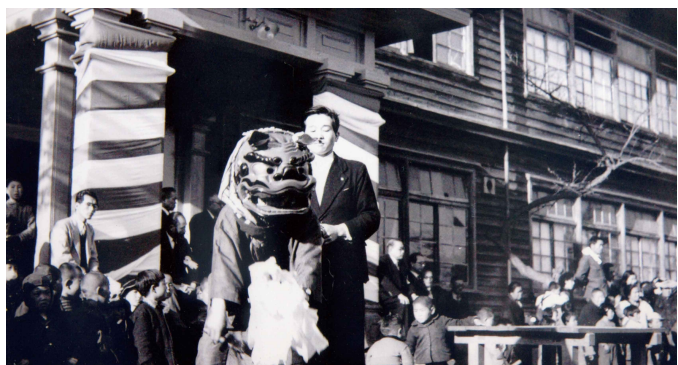
昭和29年3月30日、翌日の長野市との合併を控え、小学校に集まって解村式と獅子舞による祝賀会が行われた