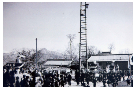
合併祝賀会場に向かう神楽

昭和29年4月1日、柳原村は近郊10ヶ村の編入合併で長野市に編入した。合併を祝し市町村ごとに装飾したトラックに役員を乗せて各地区をパレードした。柳原地区は「柳原のりんご」と「農協ひよこ」の装飾を付けて参加した。「農協ひよこ」とは当時の農協（現在の中部農業機械センター）で卵をふ化し、ひよこを出荷していたそうです。