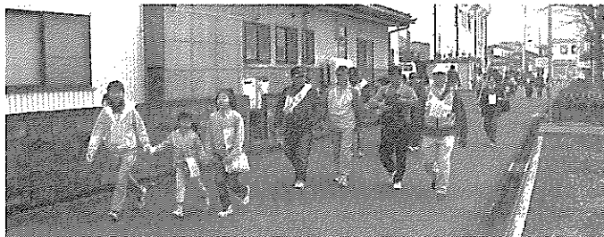
健康ウォーキング (3/13)