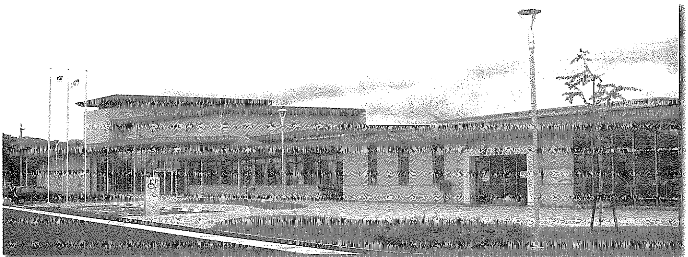
今春落成した柳原総合市民センター内に支所・公民館が移転しました。