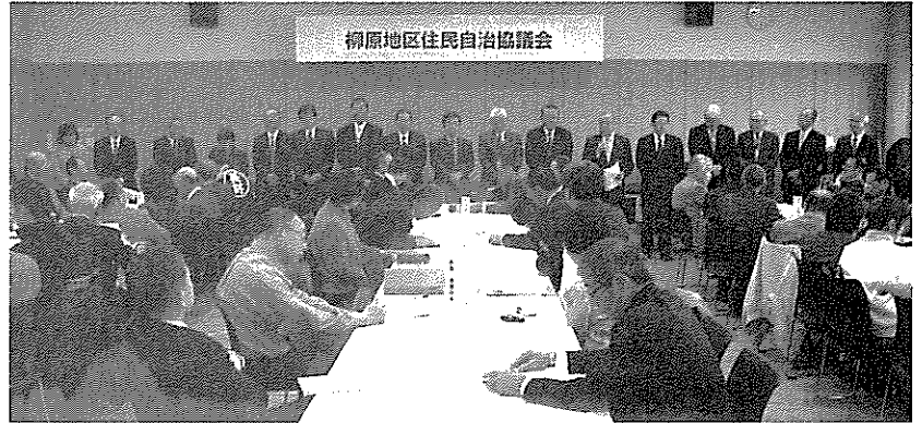
新役員のあいさつ